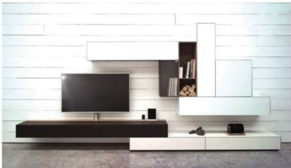
Bild und Ton im ganzen Haus

Wir planen für Sie individuelle Unterhaltungsmöbel mit unsichtbaren Lautsprechern und unsichtbarer Technik