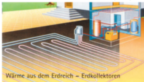
Wärme aus dem Erdreich – Erdkollektoren